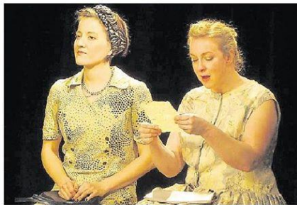
Après les retrouvailles et la liberté, les deux amies, incarnées ici par des actrices, se remémorent le calvaire qu'elles ont vécu.