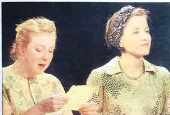
Un témoignage bouleversant sur la déportation.