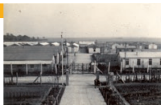
Camp de Voves