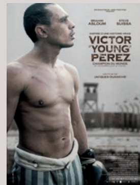
de Jacques Ouaniche (20 mars 2014, Océan film Distribution)