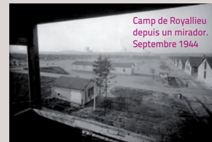
Camp de Royallieu depuis un mirador. Septembre 1944

25€/personne – 20€/adhérents du Cercil – 15€/moins de 18 ans et étudiants. Prévoir 3€ pour la visite du wagon.