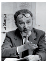
Primo Levi 17 février 1975.