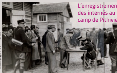
L'enregistrement des internés au camp de Pithiviers