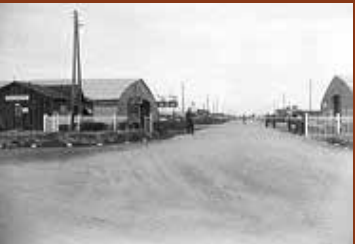
Entrée principale du camp de Gurs. F/7/15104.