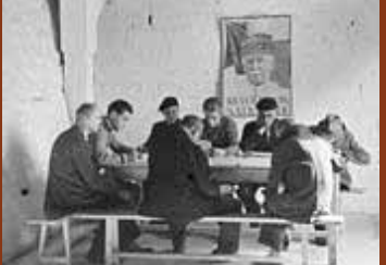
Cours au camp des Milles. F/7/15095.