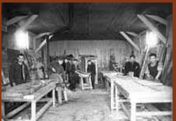
Atelier de menuiserie du camp de Pithiviers. F/7/15101.