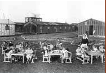
Cour du jardin d'enfants du camp de Gurs. F/7/15104.

16h30 Discussion 17h00- Conclusion : retour sur les enjeux 17h15 des humanités numériques, par Serge WOLIKOW, président du conseil scientifique de la Fondation pour la Mémoire de la Déportation et directeur scientifique du Consortium Archives des mondes contemporains