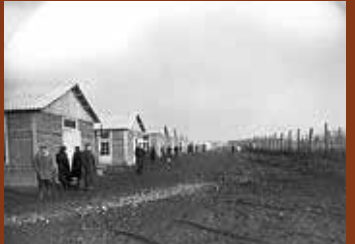
Vue sud du camp de Pithiviers. F/7/15101.