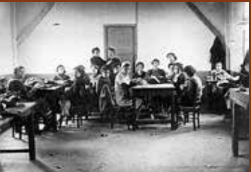
Atelier de tailleurs et couture du camp de Rivesaltes. F/7/15105.