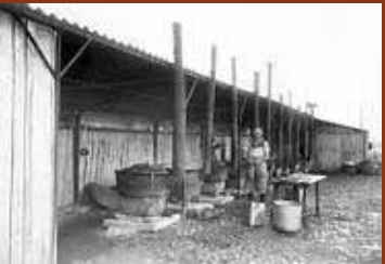
Cuisine du camp de Gurs. F/7/15104.