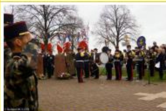
KILSTETT: 22 janvier 2016