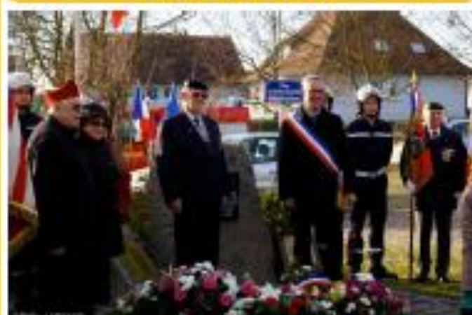
WITTERNHEIM: 13 décembre 2015