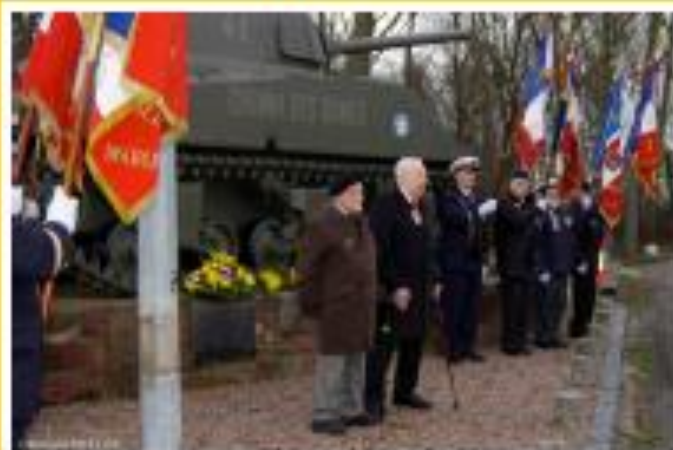
GRUSSENHEIM: 31 janvier 2016