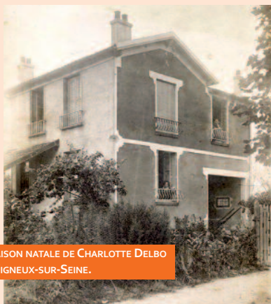
MAISON NATALE DE CHARLOTTE DELBO À VIGNEUX-SUR-SEINE.

La Librairie Les Vraies Richesses de Juvisy-sur-Orge proposera à la vente une sélection d'ouvrages.